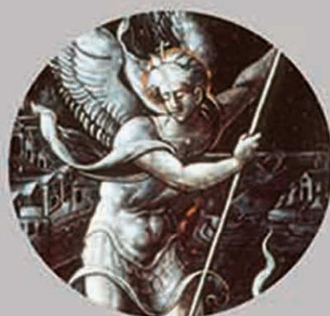
Léonard Limosin Saint Michel terrassant le dragon 1550 Inv. 2004.24.1 ; achat, 2004