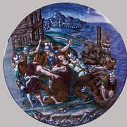
Pierre Courteys Plaque circulaire : L'Enlèvement d'Hélène Limoges, vers 1550 Inv. 45 ; dépôt du musée du Louvre, 1895