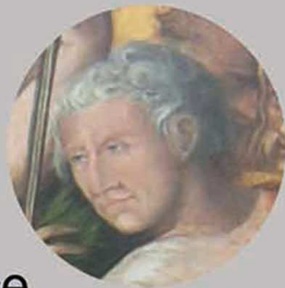
Léonard Limosin (vers 1505 – entre 1575 et 1577) L'incrédulité de saint Thomas , 1551 Huile sur bois Provient de l'église Saint-Pierre-du-Queyroix à Limoges, avant 1790 Inv. P. 172 : affecté par la Ville de Limoges, 1846

À « peinture » et « Léonard » est souvent associé le nom de Vinci. Pourtant, il est un autre Léonard, limousin celui-ci, qui marqua l'art de la Renaissance : il s'agit de Léonard Limosin, le plus célèbre des émailleurs de Limoges.