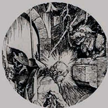
Albrecht Dürer (1471-1528) Gravure Descente aux limbes du Christ