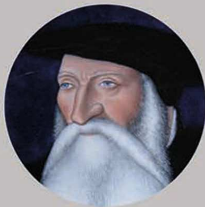
Léonard Limosin Portrait de Gallot de Genouillac Vers 1540-1546 Inv. 446 ; achat, 1987